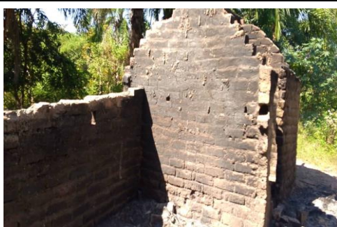
VILLAGE LUSONDE ABRIS INCENDIES